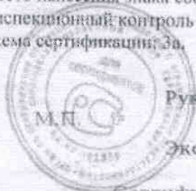
Схема сертификации: За.

ДОПОЛНИТЕЛЬНАЯ ИНФОРМАЦИЯ Место нанесения знака соответствия: в товаросопроводительной документации, на маркировочном ярлыке. Инспекционный контроль - 08.2017г., 08.2018г., 08.2019г.