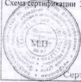
Схема сертификации З.

Место нанесения знака соответствия: на этикетке, в товаросопроводительной документации.